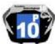
Filles / Femmes