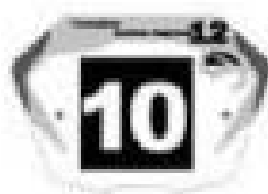
Junior F et G