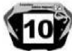
Elite F et G

A noter que les pilotes de la catégorie Novice doivent mettre les mêmes plaques que tous les autres pilotes de la catégorie garçon « Fonds Jaune avec les chiffres noirs »