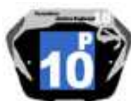
Filles / Femmes

Fond de plaque formé d'un carré de 10 cm de côté avec des chiffres d'une hauteur de 80mm mini et 8 mm d'épaisseur et d'une lettre de 40 mm de hauteur