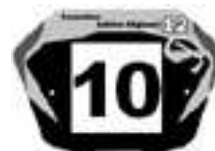
Elite F et G