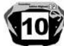
Elite1 F et G