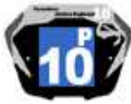
Filles / Femmes