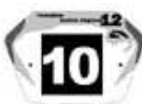
Junior Fet G / Elite2 en 20'' et Cruiser