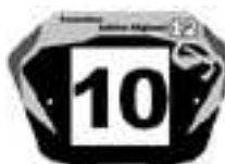
Elite1 Fet G en 20'' et Cruiser