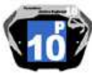
Filles / Femmes